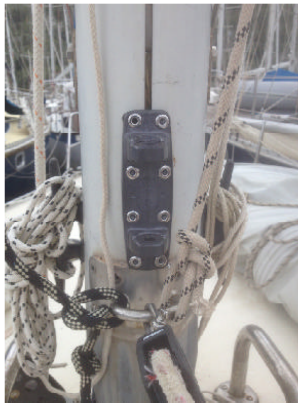
Fästet till rodkicken kom på plats