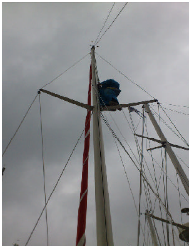
Upp i det blå

Stellans stora bekymmer var att lösa monteringen av mastfästet till rodkicken. Popnitarna var för stora för min medhavda popnit-pistol och vi övervägde att fästa beslaget med bultar istället, vilket Ingemar Taube per telefon möjligen kunde acceptera.