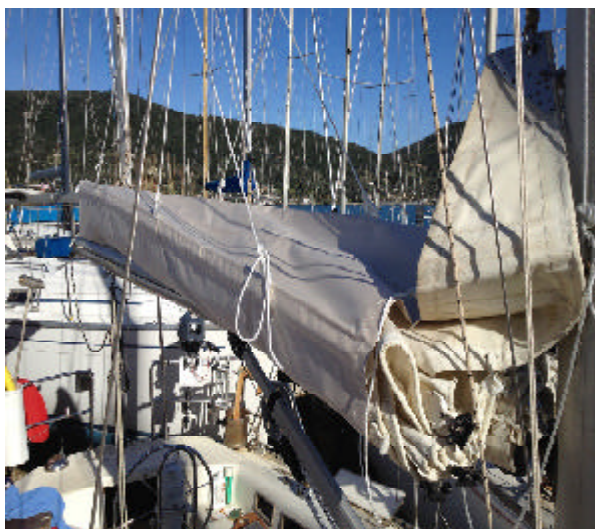
Bomkapellet med lazyjacks

Den elektriska pumpen startas genom att sätta sladden med cigarettkontakten i avsett uttag på elpanelen ovanför kartbordet. Av/på-knappen för uttaget sitter ovanför cigarettuttaget.