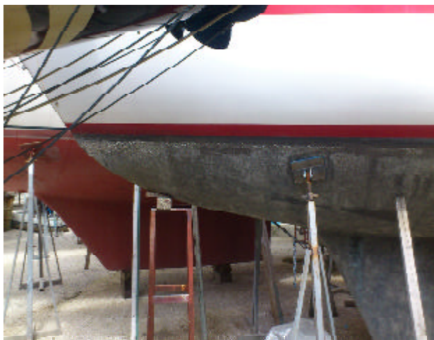
Botten ska målas

På kvällen skrev vi Inköps- och att-göra-lista.